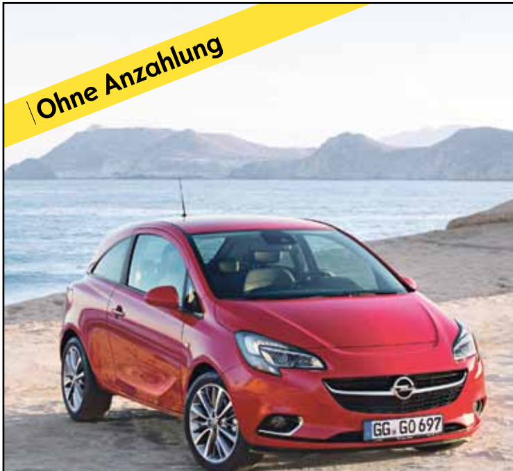
Abbildung zeigt Sonderausstattung.