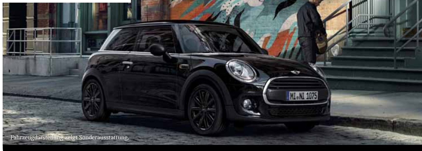
Fahrzeugarstellung zeigt Sonderausstattung.

GOKART-FEELING SCHON AB 199,00 EUR / MONAT.