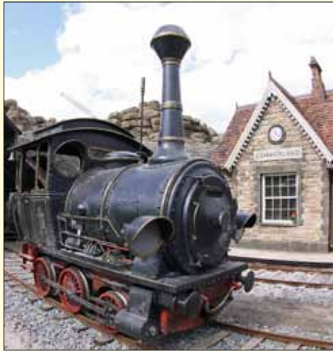
NEU! Das Originalset LUMMERLAND aus „Jim Knopf & Lukas der Lokomotivführer“

Zur Walpurgisnacht am 30. April lässt der Fantasy-Film grüßen. Elfen, Faune und Fabelwesen treiben ihren Schabernack.